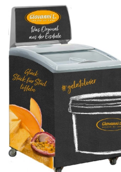
Abb.: IC155DL im Kundendekor (Modell IC155D mit Leuchtkasten)